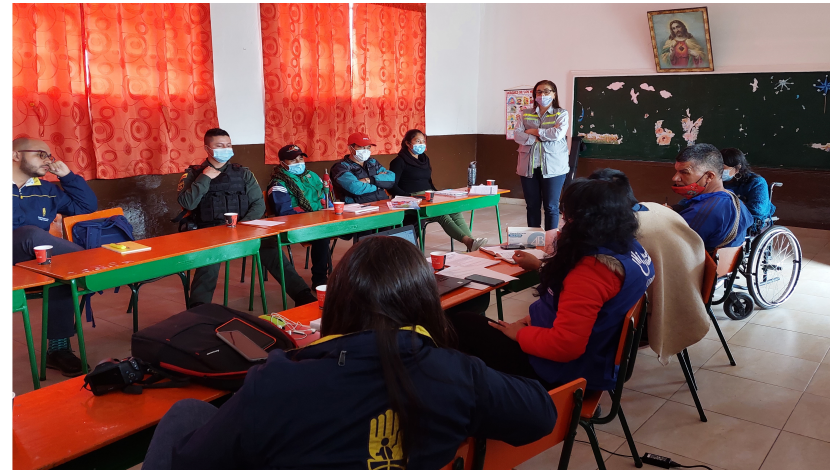
Imagen 1: III Taller de la Estrategia de comunicación en Riesgo Volcánico: volcán Riesgo y territorio en el Resguardo Indígena de Puracé